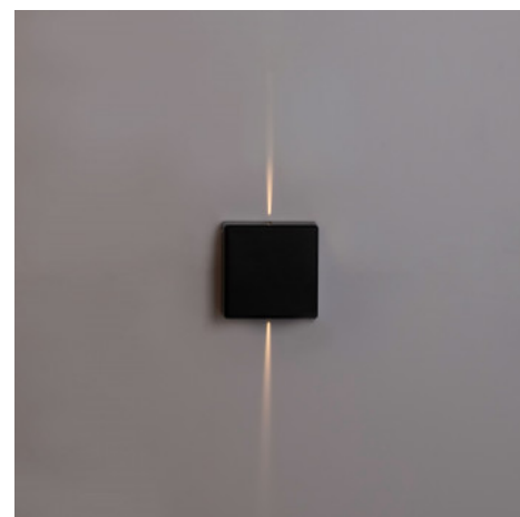
Eckige LED-Wandleuchte „Karen 2“ für den Außenbereich - 3W - IP54 - doppelseitiger Lichtaustritt