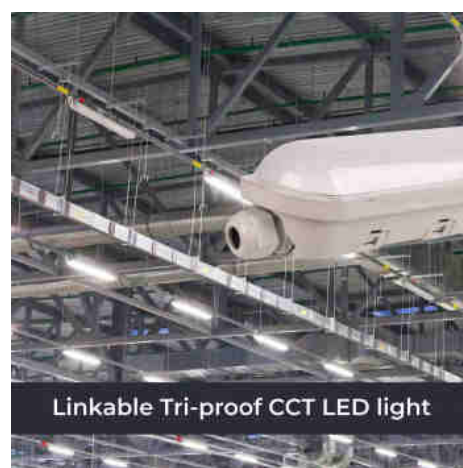
Linkable Tri-proof CCT LED light

Plafoniera stagna lineare da 120 cm di alta qualità, 40W; impermeabile e collegabile, con un'eccellente efficienza luminosa. Include un driver LIFUD dimmerabile DALI e un sistema CCT per regolare la temperatura di colore in base alle esigenze dell'ambiente. Con grado di protezione IP65 perfetto per gli ambienti più difficili.