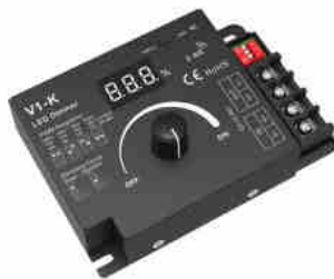
Mechanical Structures and Installations