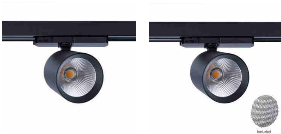
Reflektor LED 3-fazowy 4000K - 40W - CRI 95 - Sterownik Philips Xitanium - Czarny