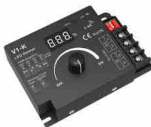
Mechanical Structures and Installations