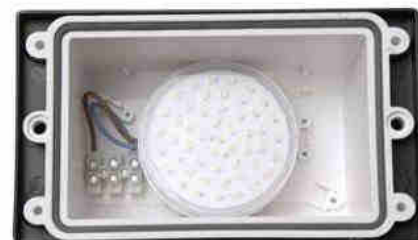
Luminária exterior LED encastrável parede Fumagalli "Leti 200 HS" 3W - IP66 - GX53 - CCT