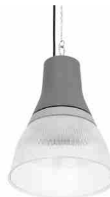
Campânula LED comercial CCT - (25W / 40W / 60W / 80W) - Difusor em policarbonato - UGR19 - Driver Lifud